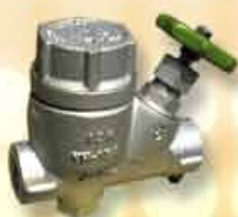
スチームトラップ(蒸気用)