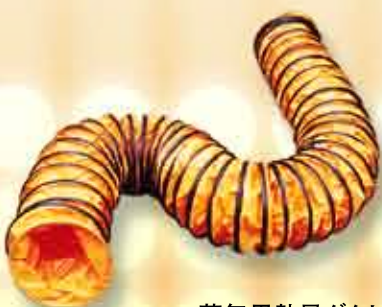
蒸気用熱風ダクト